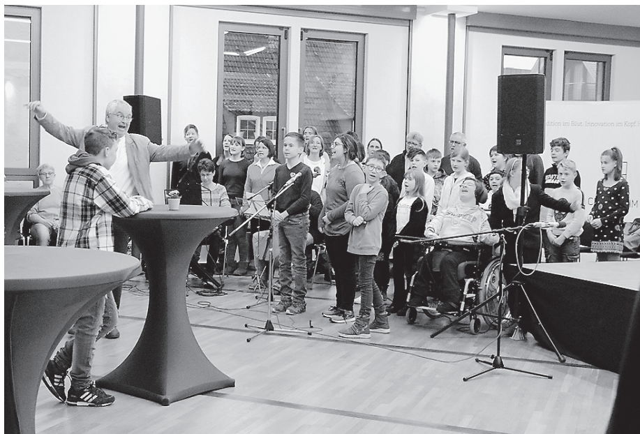
Musikalische Darbietungen fehlen bei der Ehrung nicht, wie auch im vergangenen Jahr.

Das zehnköpfige Gremium, welches aus Musik-, Schul- und Kirchenvertretern, der Stadtverwaltung sowie jeweils einem Ver-